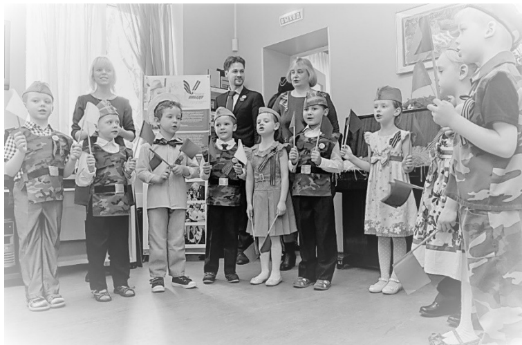
Рис 3. Подведение итогов Акции на базе дошкольного отделения ГБОУ «Школа № 2101» (Москва)