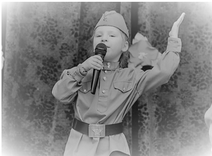
Рис 2. Старт Акции на базе дошкольного отделения ГБОУ «Школа № 1359 имени авиаконструктора М.Л. Миля» (Москва)