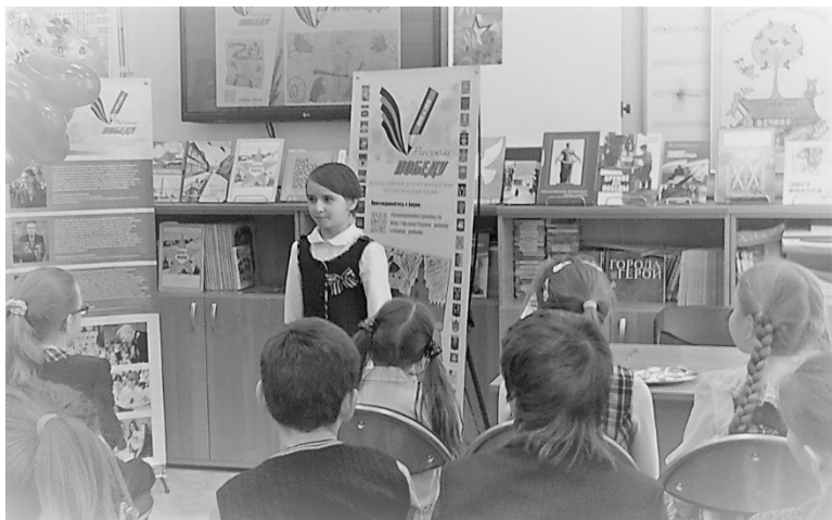
Рис 6. Проведение Акции в Библиоцентре детского чтения Выборгского района Санкт-Петербурга (Санкт-Петербург)