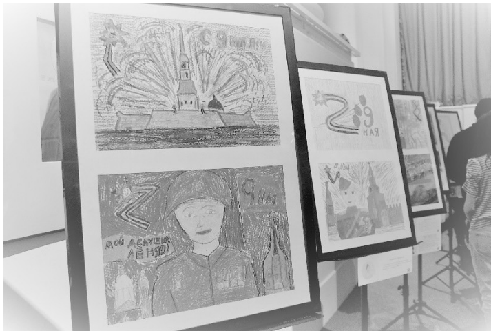
Рис 5. Выставка лучших работ учащихся школ Выборгского района Санкт-Петербурга – участников Акции (Санкт-Петербург)