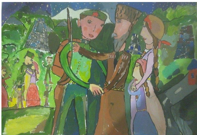
Цокова Кира, 6 лет «Возвращение домой» Республиканский Лицей Искусств (г.Владикавказ)