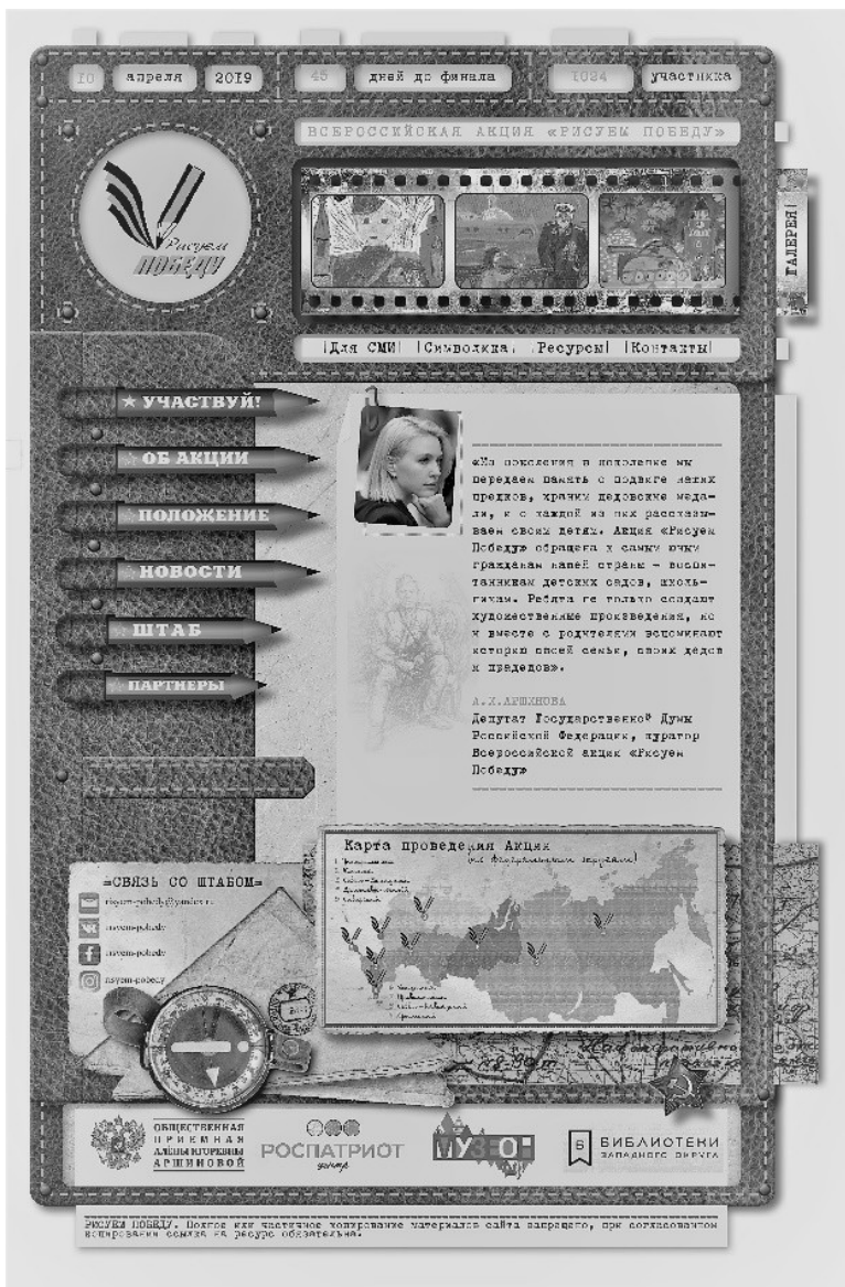
Рис 1. Внешний вид сайта Всероссийской акции «Рисуем Победу»