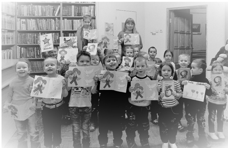
Рис 7. Читатели Центральной городской библиотеки имени В.В. Маяковского с созданными в рамках Акции творческими работами (Чувашская Республика, г. Чебоксары)