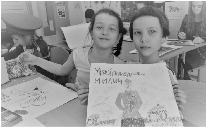
Рис 4. Учащиеся ГБОУ «Гимназия № 92 Выборгского района» принимают участие в Акции (Санкт-Петербург)